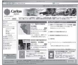
カリタスジャパンホームページ