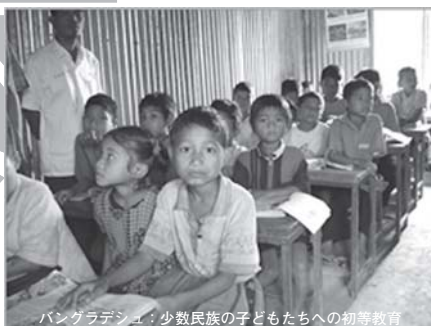
バングラデシュ：少数民族の子どもたちへの初等教育