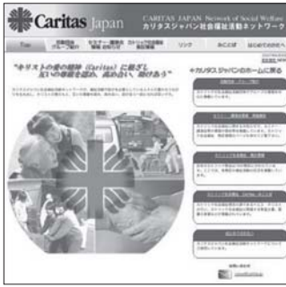
カリタスジャパン社会福祉活動ネットワーク