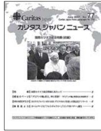
カリタスジャパンニュース