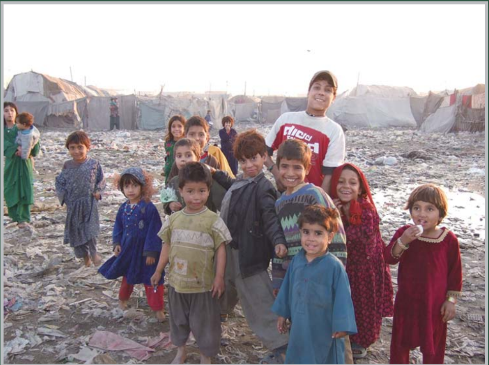
パキスタン：潜在難民の子どもたち