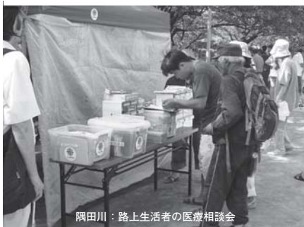
隅田川：路上生活者の医療相談会