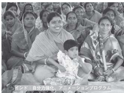
インド：自分力強化、アニメーションプログラム