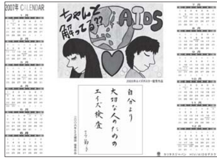
HIV/AIDS デスク作成 2007年カレンダー